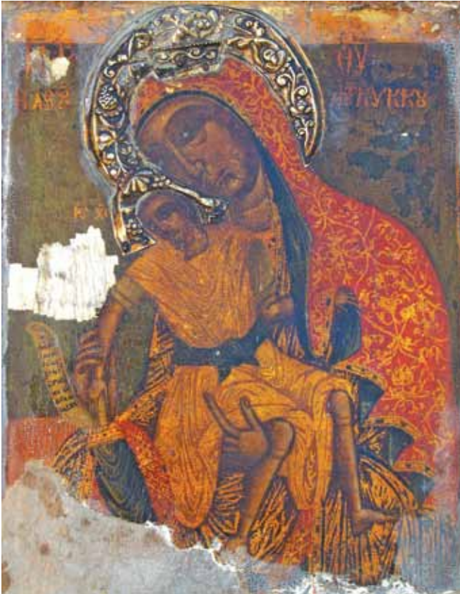
Сл. 11. икона Бо̀ородица Елеуса - Кикоска, црква Св. Аѿанасиј с. Ја̀гол Доленци, вѝора ѿоловина на XVIII век.