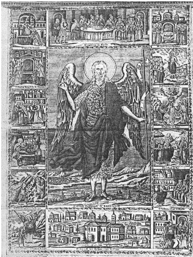
Сл.9. харџиена икона, св. Јован крстїиџел со сцени од жиџиџеџо, скиџ Св. Ана, манасџир Ивирон, 1793 з. (сџоред D. Papastratos)

може да се следи само на одредени делови, ни ја открива провиниенцијата на иконата, ктирорите и побудите што ги поттикнале на овој ктиторски потфат.