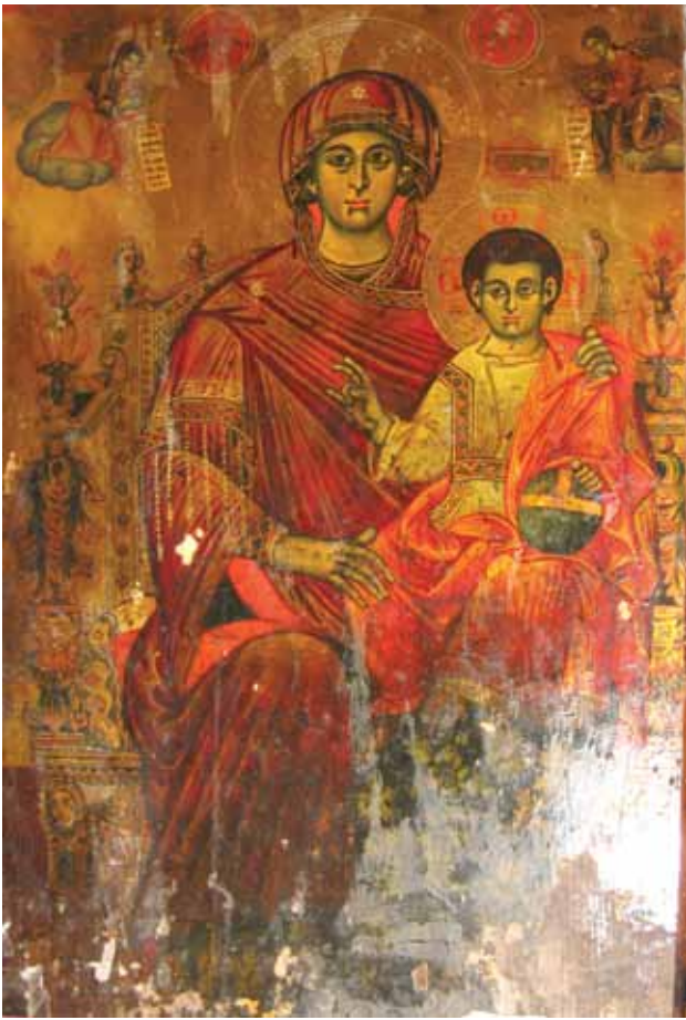
Сл. 1. икона, Богородица со Христѝос, црква Св. Богородица с. Бойџун, виџора ѝоловина на XVIII век