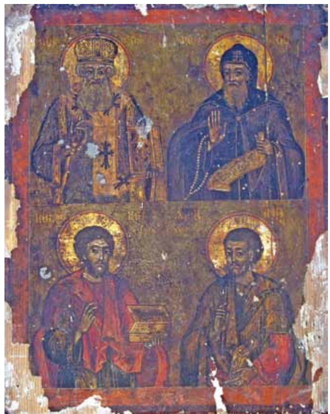
Сл.10. икона, св. Аџанасиј Александриски, св. Анџониј, св. Кузман и Дамјан, црква Св. Аџанасиј, с. Јагџол Доленци, 1780 з.

зина на манастирот Ивирон, е основан во 1730 г. додека главниот католикон е изграден во 1779 г. 19 Не е исклучена можноста монахот Паисиј да бил еден од подвижниците во братството на скитот на Св. Ана.