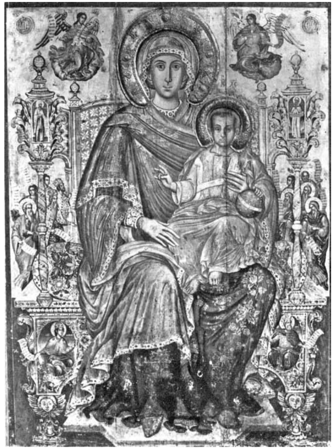
Сл. 2. икона, Богородица со Христѝос, црква Богородица Живоносен источник, Корча, 1752 г. (сѝоред Th. Popa)

на Богородица и Христос, широко отворените очи подвлечени со тенка линија, светлозелениот инкарнат со благи црвени нијанси и тонови, наборите на раскошниот мафорион што ја следат линијата на телото и раката придонесуваат за една нагласена монументалност. Стремежот кон декоративноста на формите е изразен со сликање на ѕвездите на мафорионот, како и тенките златни препендули на надлактицата на десниот ракав.